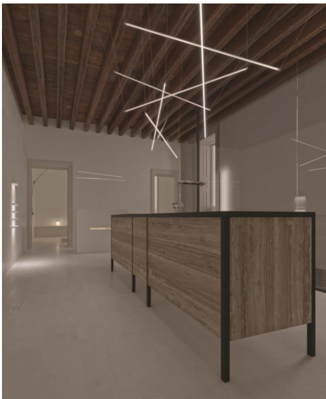
Patina, cucina 2017

La nuova collezione interpreta un concetto estremamente attuale di interior design: gli spazi vintage si integrano con gli arredi moderni, una fusione tra passato e futuro per un’atmosfera contemporanea e intima sapientemente rappresentata nell’allestimento dello spazio espositivo, progettato e curato da Bestetti Associati.