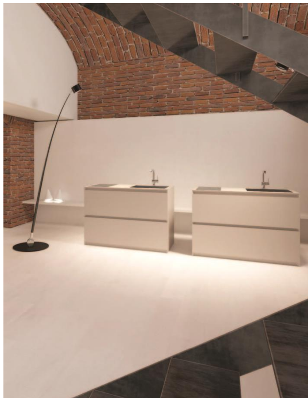
Grad45, cucina nuova finitura “Vibrant” 2017 Ceragino, cucina nuova finitura 2017

Completa l'installazione, un progetto di illuminazione di Davide Groppi studiato per valorizzare gli ambienti, creare spazi scenografici e mettere in risalto lo “stile moderno e lo spirito giapponese” di Sanwa Company.